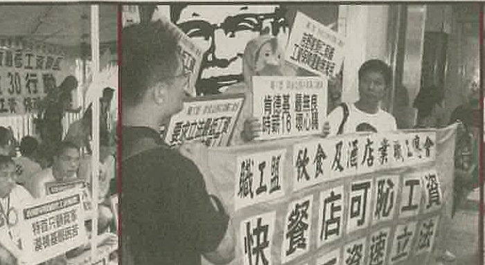
民間爭取最低工資聯盟 總食30行 立法最低工資