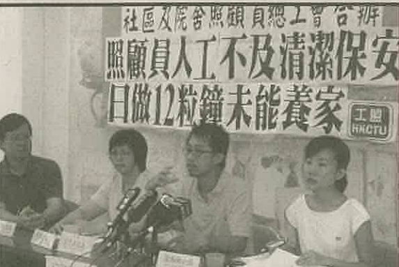
社區及院舍照顧員總工會合辦 照顧員人工不及清潔保安 日做12粒鐘未能養家