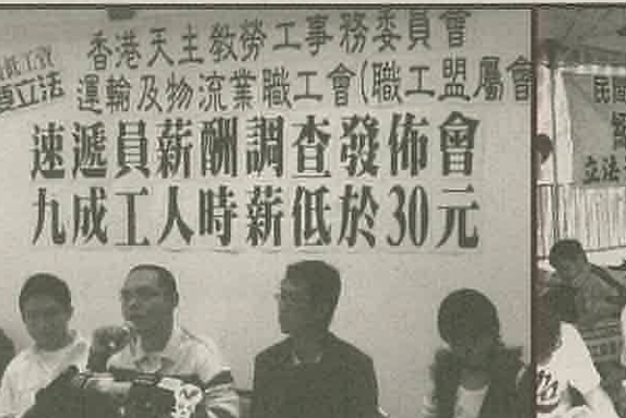
香港天主教勞工事務委員會 運輸及物流業職工會(職工盟)屬會 速遞員薪酬調查發佈會 九成工人時薪低於30元